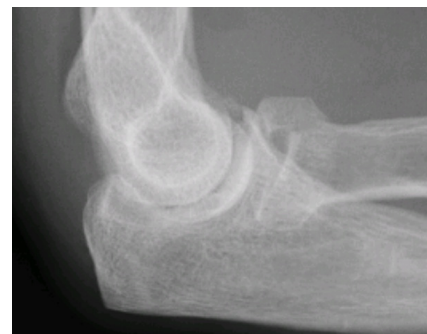
Mason Typ 2 Fraktur