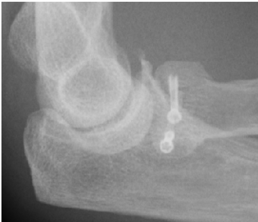
Zweifach Schraubenosteosynthese der Mason Typ 3 Fraktur (nebenbefundlich alter Proc. coronoideus Abriss)

aktiv-assistierte Beübung unter physiotherapeutischer Anleitung. Bei Implantation von Kopfprothesen wird eine Oberarmgipsschiene für 4 Wochen angelegt, wobei unter physiotherapeutischer Anleitung aus der Schiene ab der 2. postoperativen Woche initial passiv und dann zunehmend aktiv-assistiert bewegt wird. Wichtig ist vor allem die Beübung der Pro- und Supination.