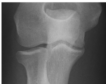
Mason Typ 1 Fraktur

Operativ sollten alle Frakturen bei Erwachsenen mit Gelenkstufen über 2mm und Abkippungen über 10° nach dem Prinzip der Gelenkrekonstruktion versorgt werden. Hierfür eignen sich Kleinfragment Schrauben oder resorbierbare Stifte. Es muss stringent darauf geachtet werden das Osteosynthesematerial entsprechend unter Gelenkflächenniveau zu platzieren, um iatrogene Knorpelläsionen zu vermeiden.