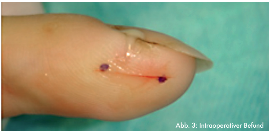
Abb. 3: Intraoperativer Befund

Täglich wechselnde trockene/ feuchte Verbände, ggf. mit Fettgaze. Weiterhin ist die Ruhigstellung in einer Fingergipsschiene für wenige Tage bis zum Abklingen der Symptome erforderlich. Je nach Ausmaß des klinischen Befundes sollte mit einer erregerunspezifischen Antibiose mit z.B. Cephalosporinen oder Ciprofloxacin begonnen und diese im Verlauf nach Antibiotogramm umgestellt werden (Zeitraum ca. 5-7 Tage). Der Arm sollte hochgelagert und gekühlt werden. Im Verlauf kann der Finger nach klinischem Befund aktiv beübt werden.