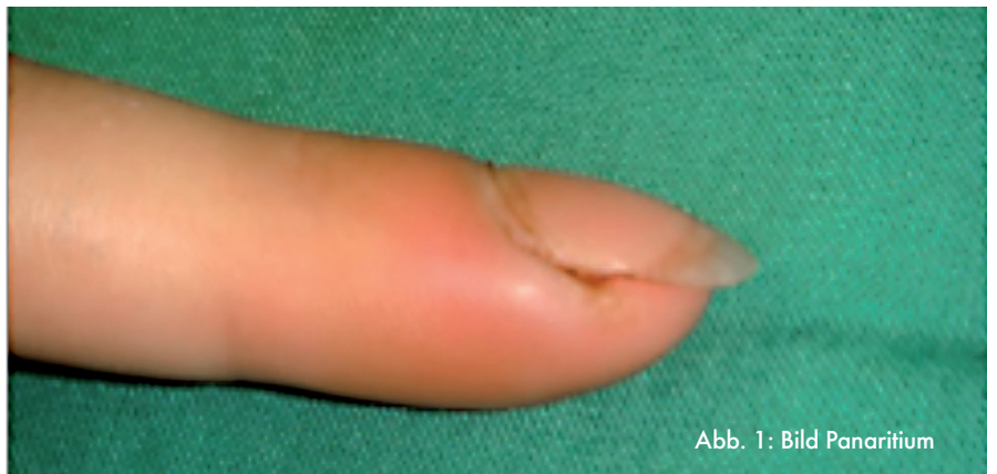
Abb. 1: Bild Panaritium

40. Orthopädentreffen Mittwoch, 22. Oktober 2014, 19:00 Uhr Burg Ravensburg, Sulzfeld