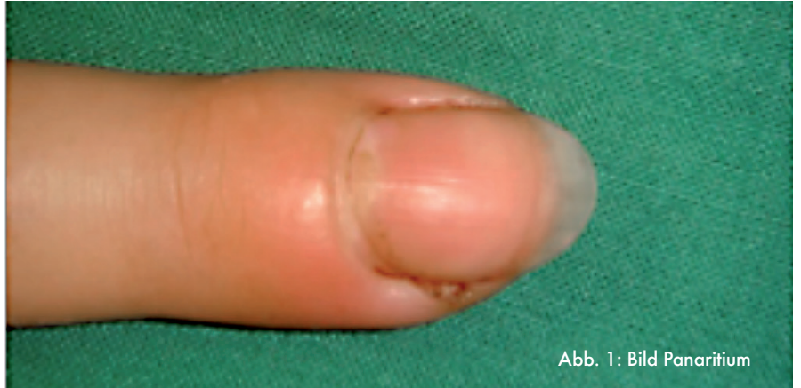
Abb. 1: Bild Panaritium